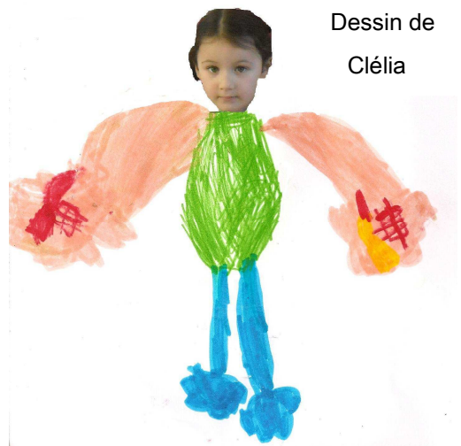
Dessin de Clélia